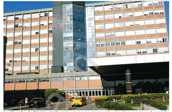
Instituição de Canoas terá nova empresa responsável pelos serviços de saúde

Além da diferença entre os mosquitos vetores, que, no caso da dengue, é o Aedes aegypti , as doenças se diferenciam pelo quadro clínico. O paciente diagnosticado com dengue pode começar a sentir dores abdominais intensas e, no pior dos casos, pode apresentar hemorragias internas, o que não acontece na oropouche. No caso da oropouche geralmente a pessoa tem febre e dores por alguns dias e eles desaparecem em seguida. Após uma semana, o quadro da doença retorna, até sumir novamente.