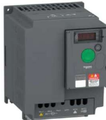
INVERSOR DE FREQUÊNCIA ATV310 - 5.5 kW - 380-460 VAC TRIFÁSICO - ATV310HU55N4E

R$ 2.469,99 em até 12x de R$ 205,83 Sem juros ou R$ 2.222,99 no pix