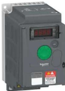
INVERSOR DE FREQUÊNCIA ATV310 - 0.37 kW - 380-460 VAC TRIFÁSICO - ATV310H037N4E