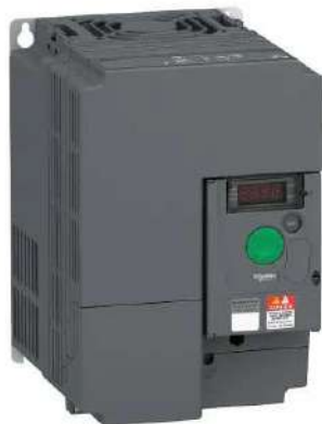
INVERSOR DE FREQUÊNCIA ATV310 - 7.5 kW - 380-460 VAC TRIFÁSICO - ATV310HU75N4E