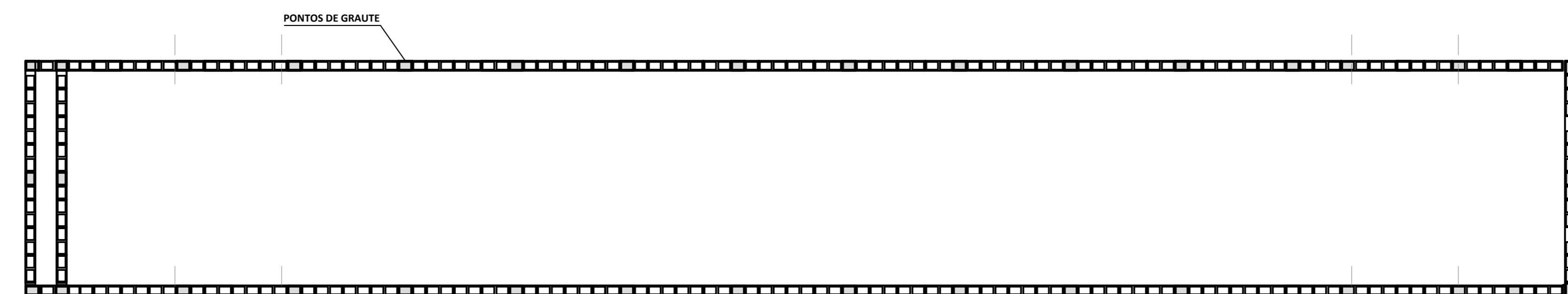
PONTOS DE GRAUTE ESCALA 1/50