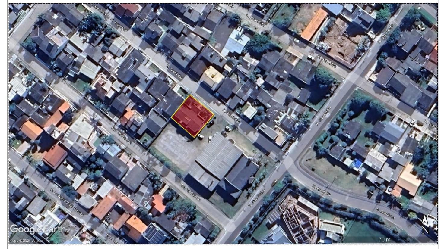
IMAGEM GEO ESC.:1/1000