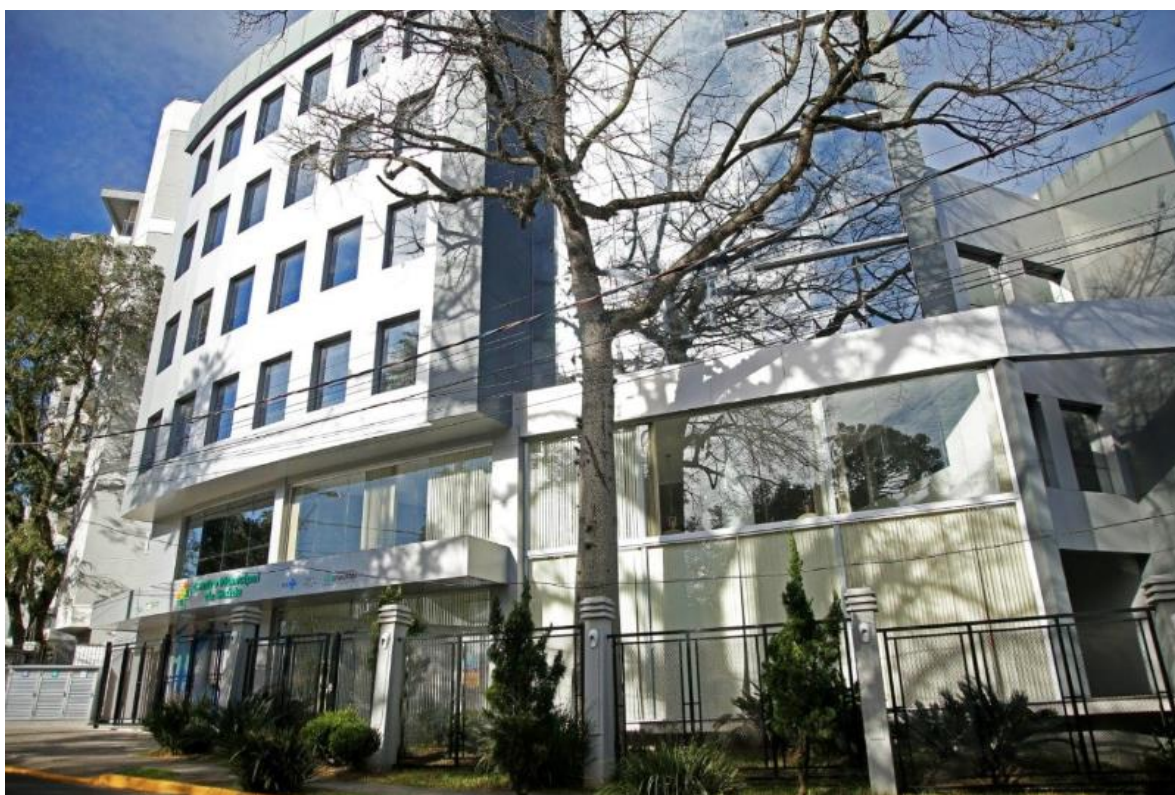
Figura 02 – Centro Municipal de Saúde

O objeto é caracterizado pelo Memorial Descritivo e os Projetos de PPCI ali descritos, em sua integralidade (isto é: pranchas, documentos, orçamentos e quaisquer outros componentes).