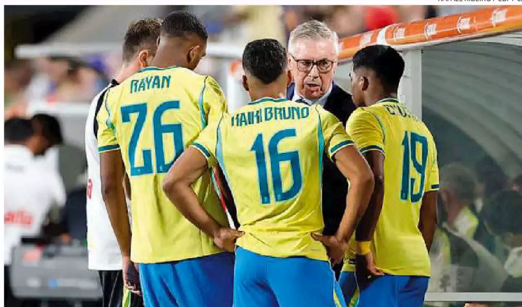
Seleção Brasileira ainda fará três amistosos preparatórios para o Mundial, que começa em junho