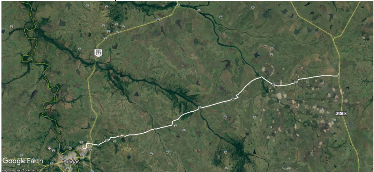
Imagem 01 (roteiro).

Conforme levantamento realizado o percurso mensal será de 832 km.