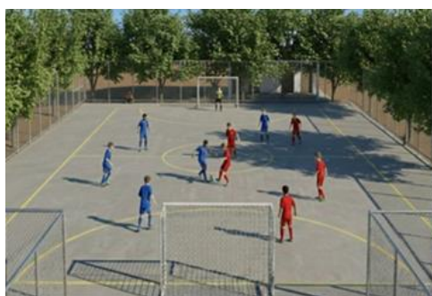
Quadra com Alambrado