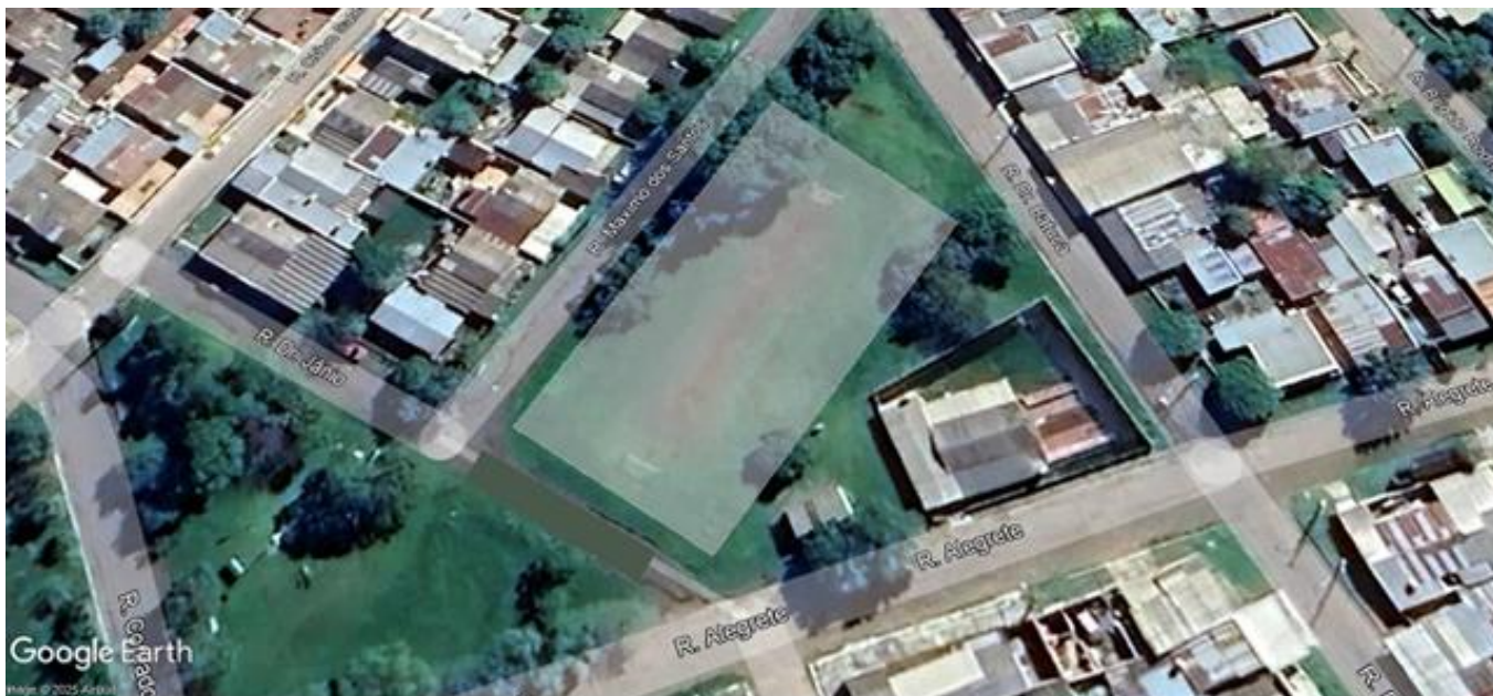
Imagem localização através do Google Earth