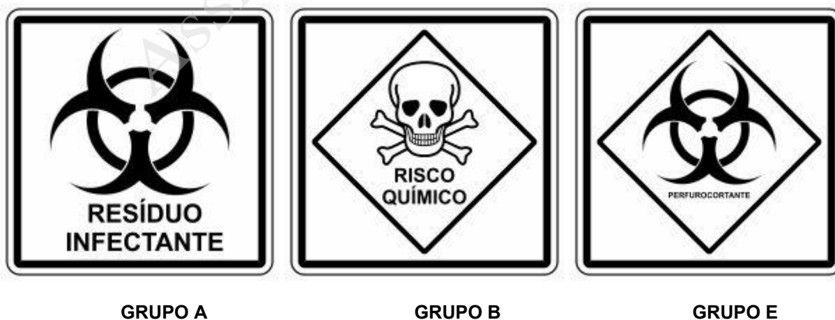
Figura 02: Identificação conforme classificação dos resíduos de acordo com a RDC nº 222/2018.

De acordo com a RDC/Anvisa nº 222/2018), os símbolos que identificam a classificação dos resíduos de serviço de saúde são (Figura 02):