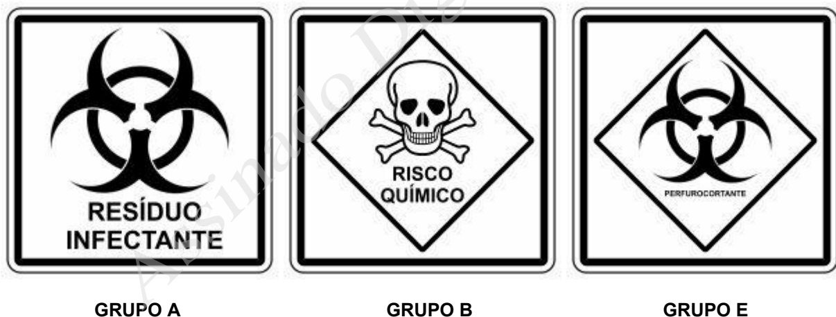
Figura 02: Identificação conforme classificação dos resíduos de acordo com a RDC nº 222/2018.

De acordo com a RDC/Anvisa nº 222/2018), os símbolos que identificam a classificação dos resíduos de serviço de saúde são (Figura 02):