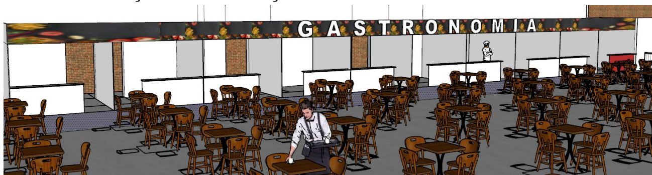
Imagem referência acima

Serão 10 (dez) unidades de stands montados em placas laminadas e divisórias em estruturas de alumínio anodizado fosco, medindo cada unidade 3X3x2,20, com balcão de atendimento em toda a sua extensão frontal, com testeira frontal medindo 3X0,50 em estrutura metálica e placas laminadas, aplicadas acima do stand na parte frontal, com instalação elétrica mono e/ou trifásica ajustada a necessidade cada expositor. Iluminação através de lâmpadas led tubulares. Cabeamento e quadro de disjuntores individualizados e/ou de acordo com a necessidade de cada expositor.