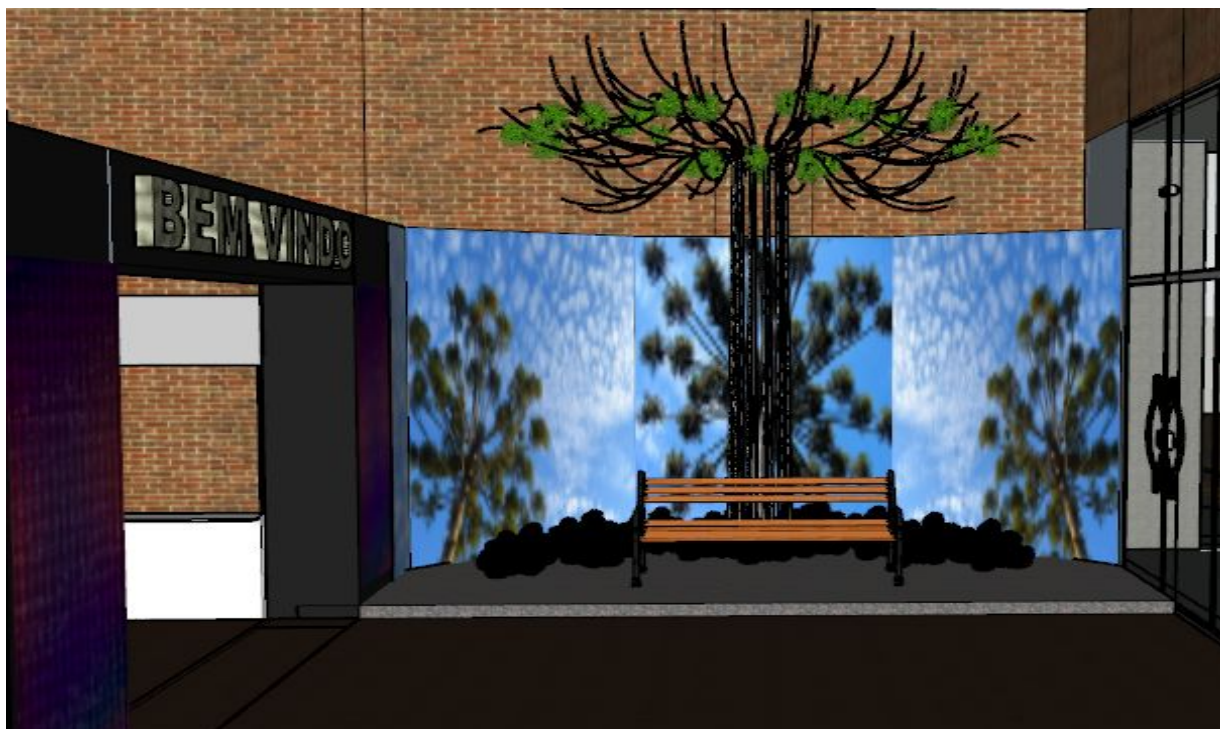
Imagem referência acima