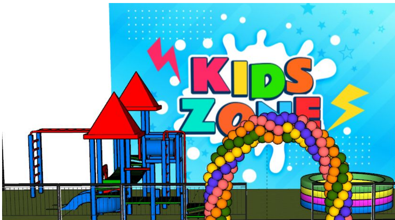
Imagem referência acima

Fica a cargo da produtora organizar e implantar o espaço destinado para as crianças contendo um Playground e brinquedos infláveis (mediante aprovação da Secretaria de Turismo) em excelente estado e 02 (dois) recreacionistas. No espaço interno não será permitida a venda ou comercialização de alimentos ou bebidas.