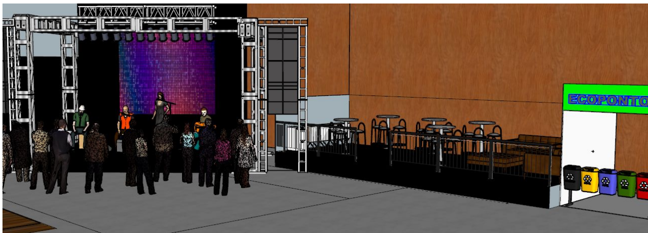
Imagem referência acima

Será 01 (um) lounge ao lado direito palco, com olhar de frente, medindo 9,00X3,50X0,50, construído em estrutura tubular metálica, composta por barras de ferro de ferro 40X40, 30X30, Cantoneiras de 2" e de 1", barras chatas de 1" e 3/4", revestido com chapas de compensado naval fenólico de 25mm, pintadas de preto, com guarda corpo conforme ABNT e escada de acesso. Pés em tubo 40X40, com regulagem de altura e sistema de travamento através de parafusos e/ou pinos, cada um com 10 mesas bistrô cromadas com tampo de vidro, 20 Banquetas cromadas com assento estofado branco, 02 sofás branco de 2 lugares, 01 mesa de centro medindo 0,60x0,60x0,50 na cor branca, uma mesa de canto medindo 0,80 de diâmetro com 45 de altura na cor branca, 1 Balcão Bar em L medindo 3X1X0,50X1 construído em marcenaria com chapas de melanina brancas. Guarda corpo em torno dos Lounges, em estrutura metálica encaixada na base visando segurança e resistência da mesma.