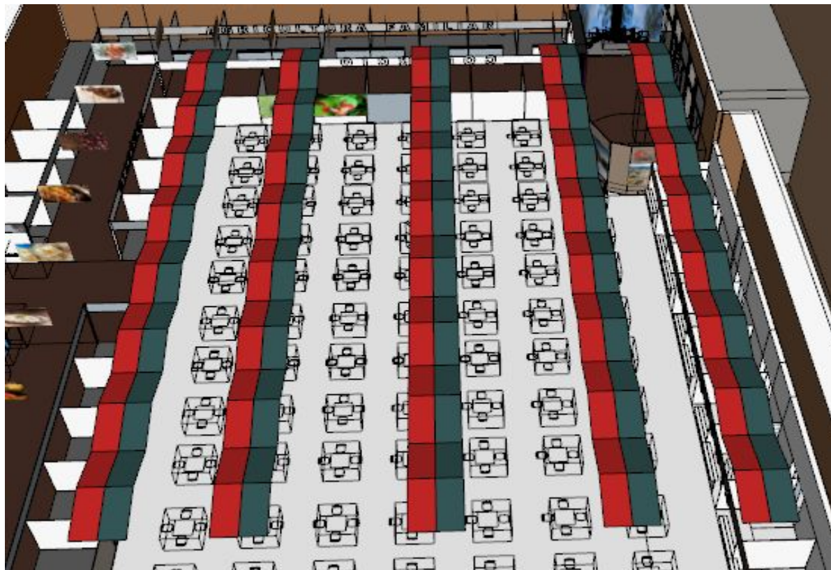
Imagem referência acima

É de obrigação da produtora fornecer e instalar 600m 2 de tecidos, nas cores a serem escolhidas pela Secretaria de Turismo, para o servir de cenário de teto na área interna do evento, acima da Praça de Alimentação, conforme projeto.