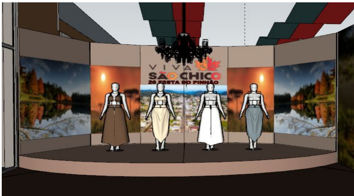
Imagem referência acima