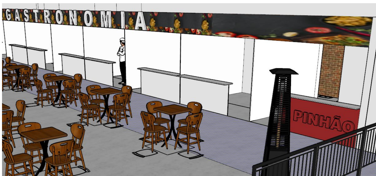
Imagem referência acima