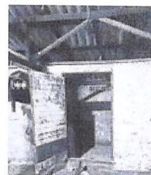
Crime foi frente de galpão

Novo Hamburgo - Dois homens e duas crianças pequenas ficaram mais de três horas amarrados dentro de um cômodo de uma casa na chácara onde um homem foi executado com um tiro na cabeça, em Novo Hamburgo. O crime aconteceu no final da tarde de quarta-feira, na Estrada Walahai, no bairro Lomba Grande.