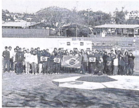
Turmas pintaram bola de futebol no chão nesta terça-feira

abct+ Veja mais notícias sobre a cidade de Sapiranga em abcmails.com.br/sapiranga