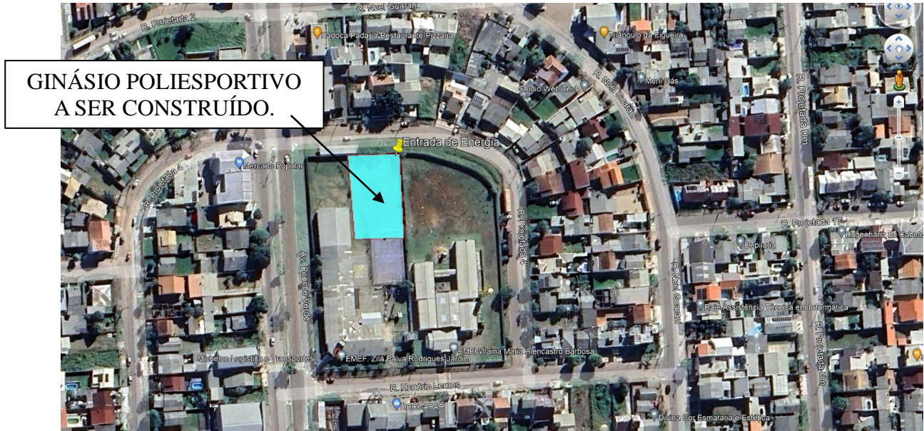
Figura 1 - Implantação Ginásio Poliesportivo Jardim dos Lagos (em azul no mapa).

Localização da entrada de energia a ser instalada 30^{\circ} 6'51.31''S 51^{\circ}21'54.81''O .