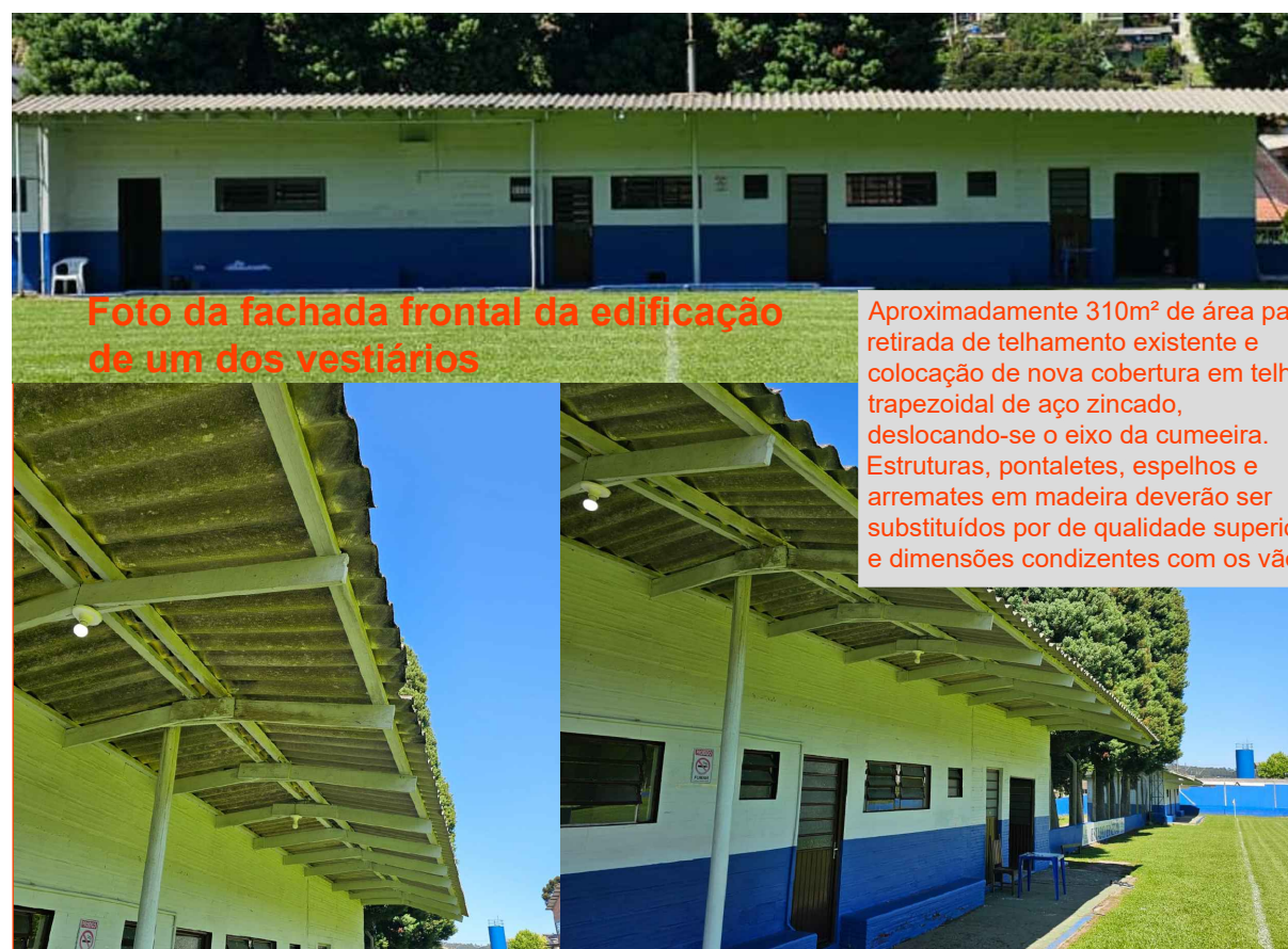
Foto da fachada frontal da edificação de um dos vestiários

Aproximadamente 310m 2 de área para retirada de telhamento existente e colocação de nova cobertura em telha trapezoidal de aço zincado, deslocando-se o eixo da cumeeira. Estruturas, pontalões, espelhos e arremates em madeira deverão ser substituídos por de qualidade superior e dimensões condizentes com os vãos.