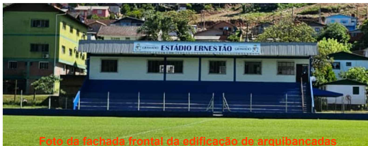
Foto da fachada frontal da edificação de arquibancadas