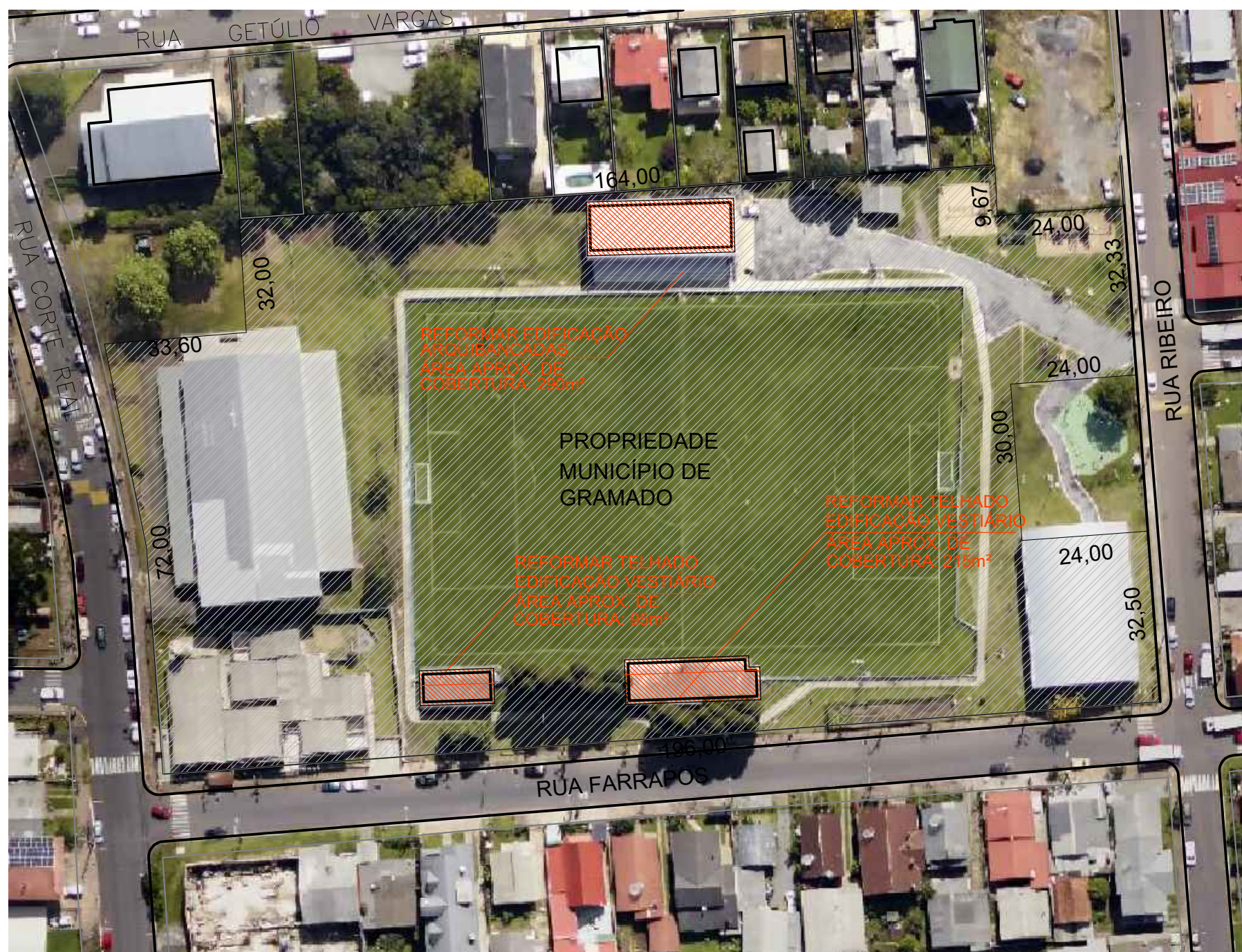
PLANTA DE LOCALIZAÇÃO ESC 1/1000

Aproximadamente 310m 2 de área para retirada de telhamento existente e colocação de nova cobertura em telha trapezoidal de aço zincado, deslocando-se o eixo da cumeeira. Estruturas, pontalões, espelhos e arremates em madeira deverão ser substituídos por de qualidade superior e dimensões condizentes com os vãos.