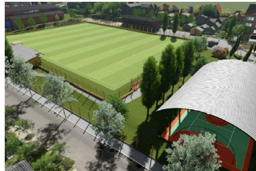
VISTAS AÉREAS - Complexo Esportivo Ernesto Volk

Aproximadamente 290m 2 de área para retirada de telhamento existente e colocação de manta termo-acústica e nova cobertura em telha trapezoidal de aço zincado. A estrutura metálica existente da cobertura irá permanecer.