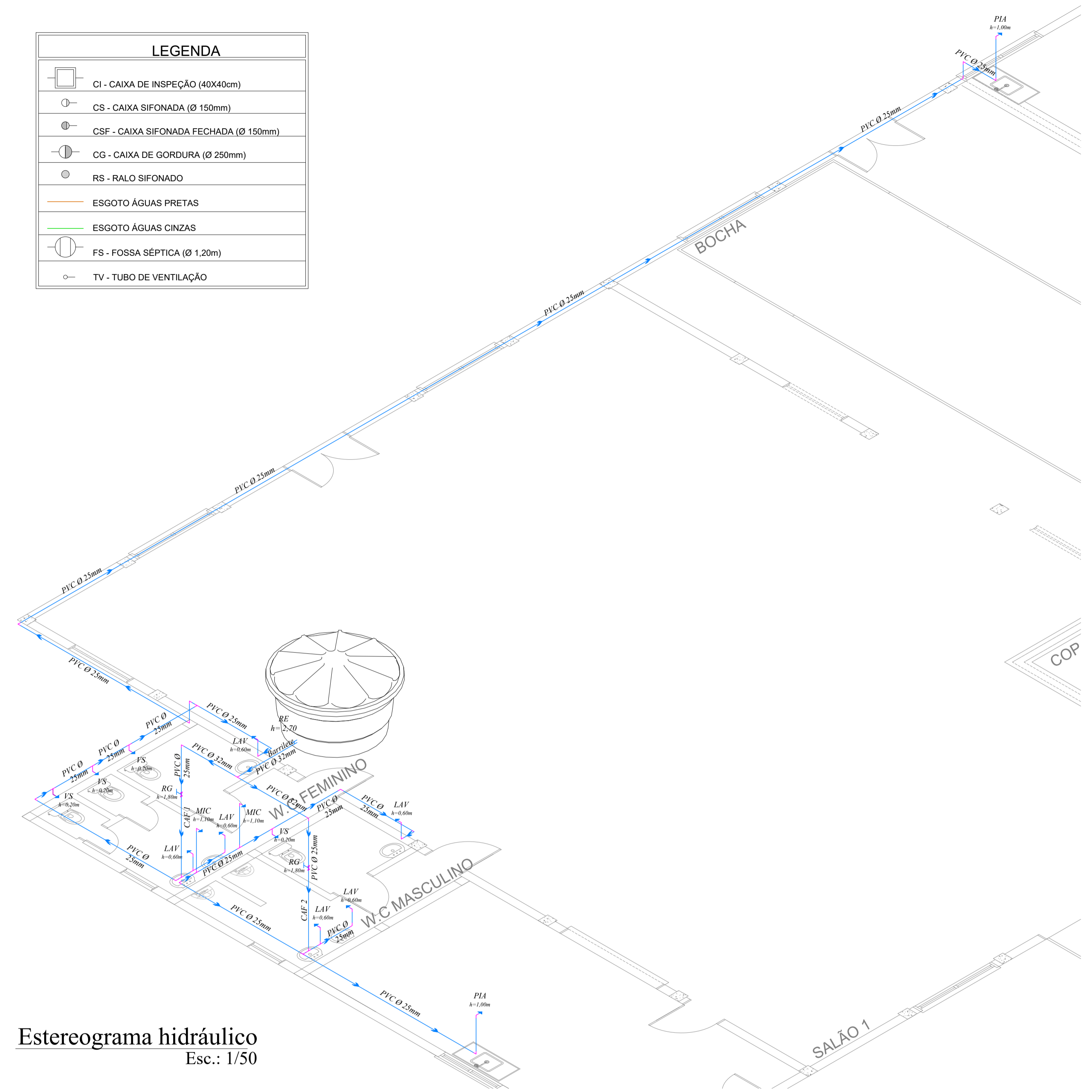
Estereograma hidráulico Esc.: 1/50