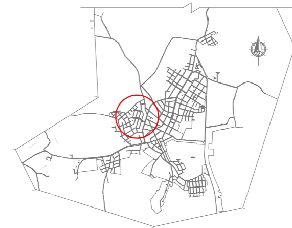
MAPA GERAL PIRATINI Esc.: 1/75000