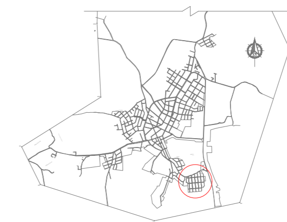
MAPA GERAL PIRATINI Esc.: 1/75000