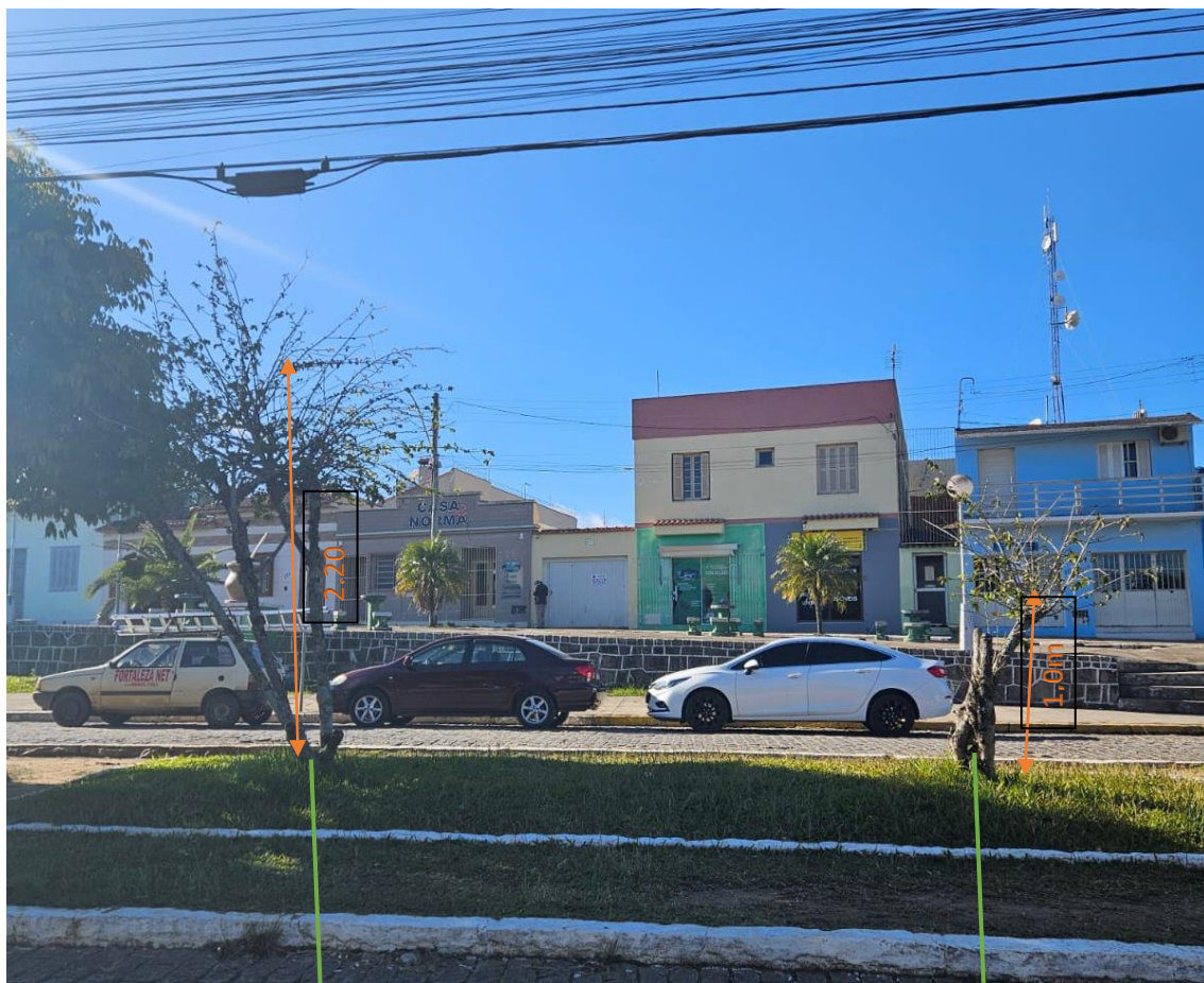
Rosa Sinensis Hibiscus