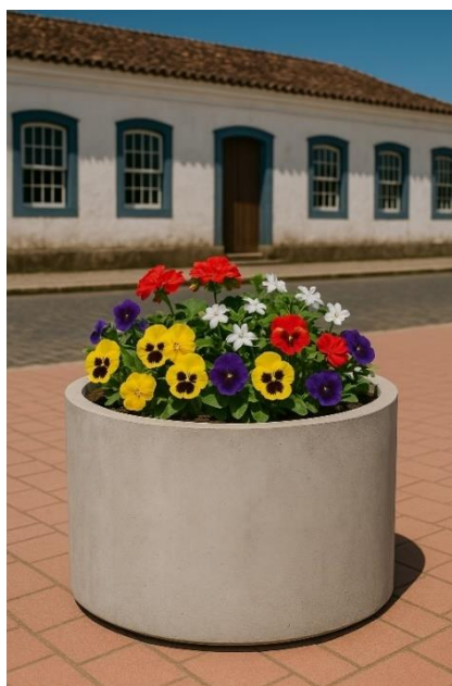
Figura 1 - Imagem ilustrativa da floreira

Outras espécies de similar comportamento poderão ser utilizadas, desde que compatíveis com o clima local, porte reduzido e caráter ornamental não invasivo.