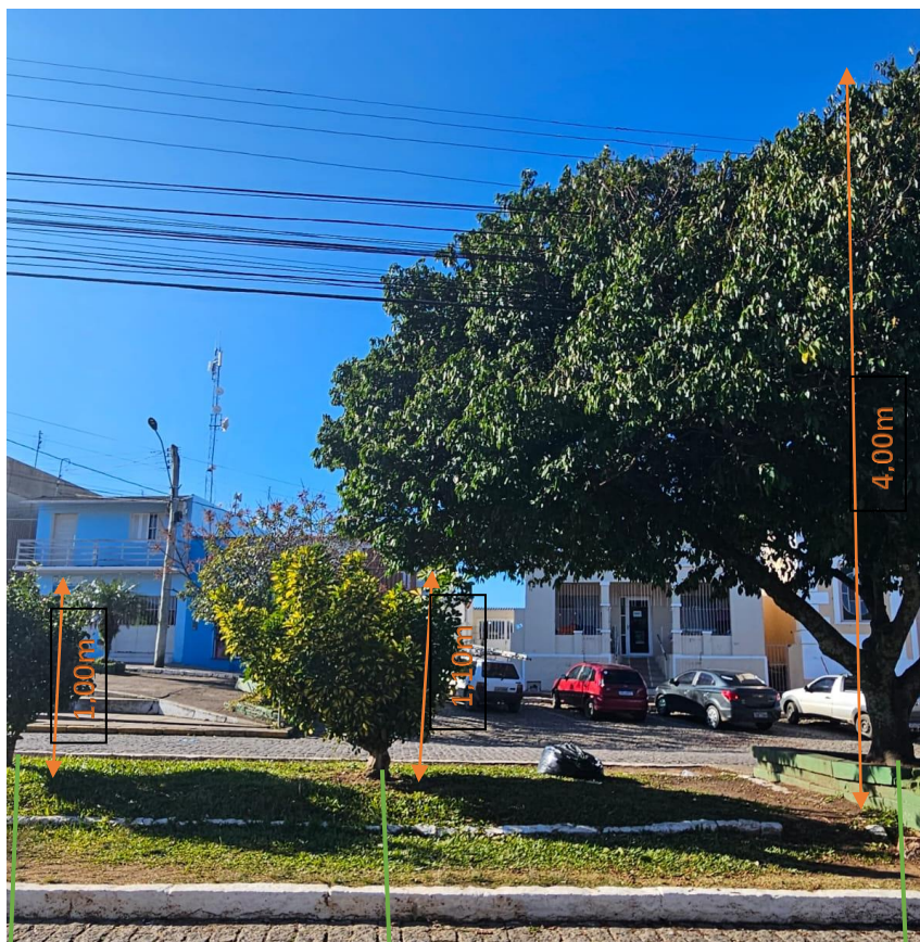
Rosa Sinensis Hibiscus