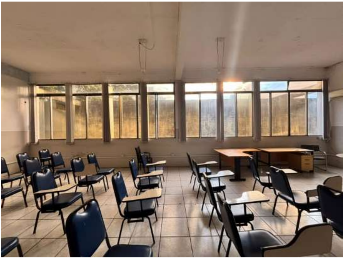
“5,81x2,30 e 5,74x 2,30 – Janelas/vidros do auditório 9BPM”