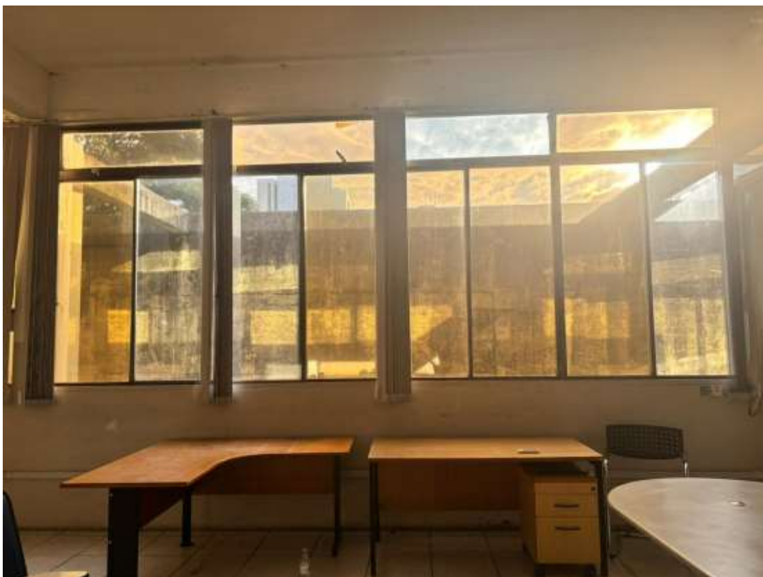
“5,81x2,30 – Janelas/vidros do auditório 9ºBPM”