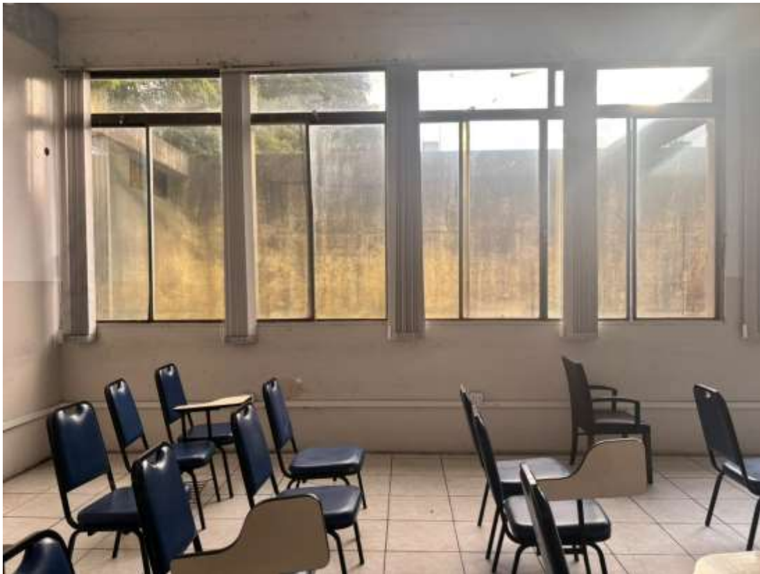
“5,74x 2,30 – Janelas/vidros 9ºBPM”