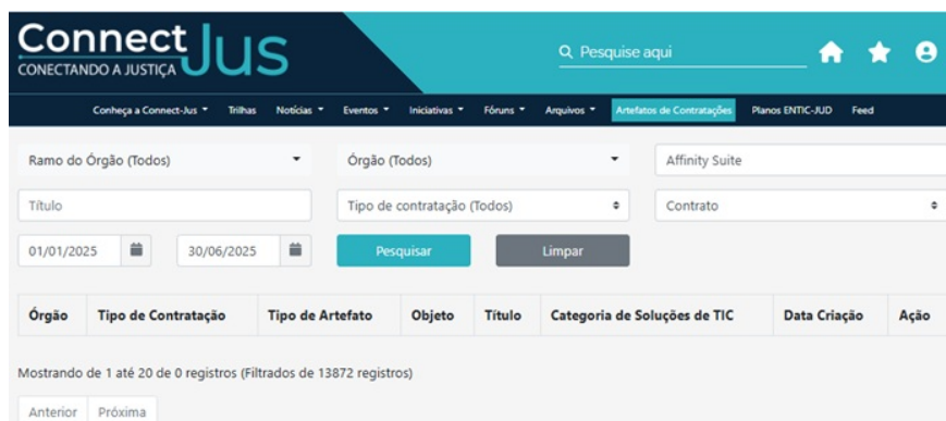
Figura 3 - Captura de tela da pesquisa do aplicativo Affinity no Connect JUS.

Ainda, como um argumento adicional para justificar a exclusividade do ADOBE, pesquisou-se também pela existência de contratações públicas das principais alternativas profissionais, não tendo sido possível encontrar nenhuma contratação, conforme também apresentado na Figura 3: