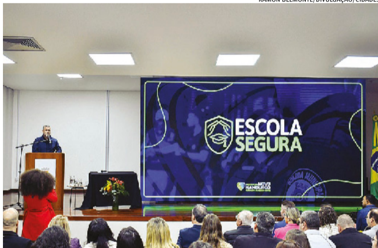
Dentre as ações está a instalação de câmeras com uso de inteligência artificial

ESTADO DO RIO GRANDE DO SUL PREFEITURA MUNICIPAL DE CORONEL PILAR