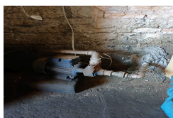
WhatsApp Image 2026-03-06 at 11.44.24.jpeg 253 KB

Atenciosamente, GEOSINOS - Serviços Geológicos e Ambientais