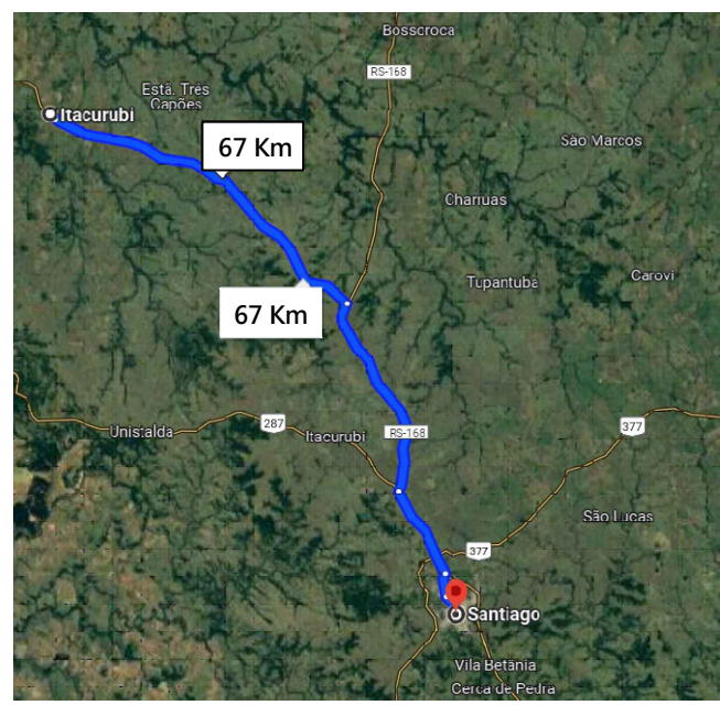
DMT DE PROJETO