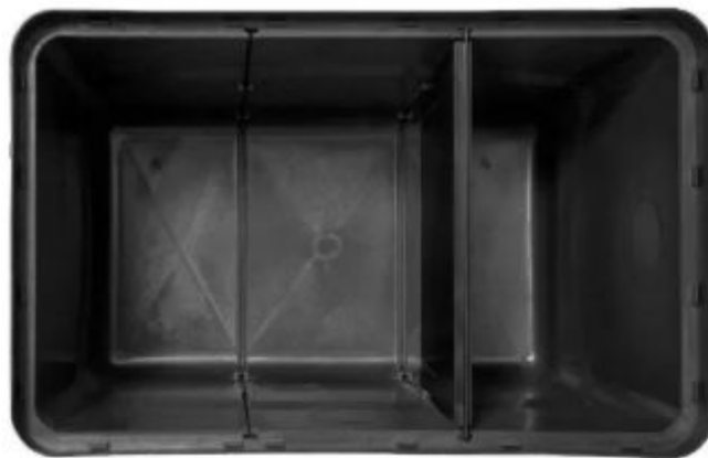
Figura 2 - Representação interna da caixa de gordura 250L

5.5. CAIXA DE GORDURA ESPECIAL 250L, EM POLIPROPILENO, MEDIDAS 96X58X61 (CM) COM SEPTO FIXO E FECHAMENTO HERMÉTICO.