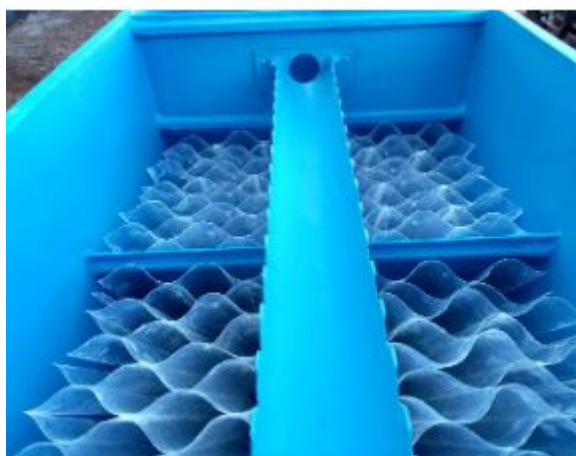
Figura 1 - Representação interna da caixa de gordura 500L

As Caixas de Gordura fabricadas em Plástico Reforçado com Fibra de Vidro (P.R.F.V.) são utilizadas para a remoção de materiais lipídicos do efluente bruto. Nesse equipamento não há a remoção automática do material sobrenadante e sim o acúmulo desses materiais, que deverão ser removidos manualmente, periodicamente, e destinados a locais adequados. É um equipamento bastante utilizado como tratamento preliminar em estações de tratamento de efluentes sanitários que tenham contribuição de efluentes gerados em cozinhas ou refeitórios (fábricas, hotéis, hospitais, por exemplo). A caixa de gordura será formada por um tubo receptor, onde entram os despejos. Do outro lado, há um septo não removível (dispositivo formado por uma saída com tubo em diâmetro nominal superior ao da entrada, além de um joelho e outro pequeno tubo voltado para baixo (formando uma saída sifonada)).