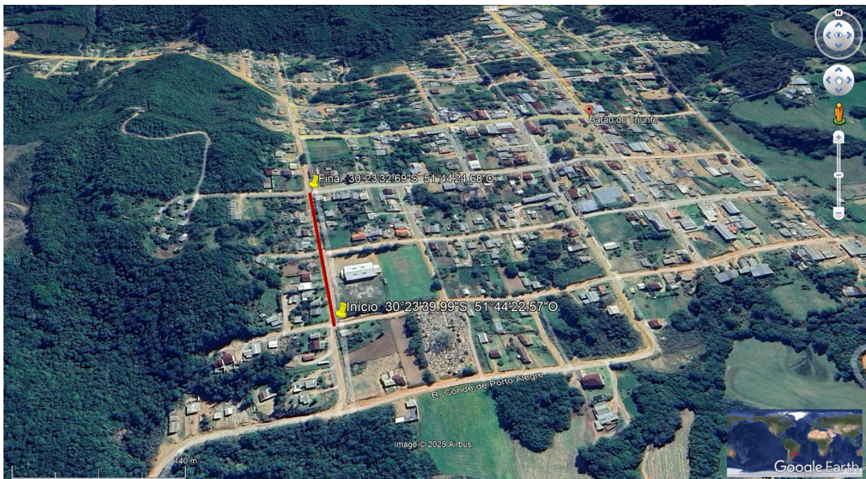
Figura 1 – Localização da rua

O presente trabalho tem por objetivo o estudo geotécnico de solos e rochas para a Elaboração de Infraestrutura Urbana – Pavimentação de Vias com PVS. A gleba está localizada na Rua Pastor Jovelino Antônio da Silva – Centro – Município Barão do Triunfo/RS, com uma área 2.473,60m 2 , na Coordenada geográfica: Início 30°23'39.99"S 51°44'22.57"O e Final 30°23'32.69"S 51°44'24.68"O.