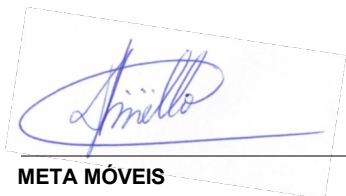
META MÓVEIS Diretoria Comercial

BANCO CEF (104) AG: 2281 OP: 1292 C/C: 000577266808-7