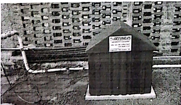
Ilustração dos equipamentos

VALOR TOTAL: R$ 4.900,00 (QUATRO MIL COM NOVECENTOS REAIS).