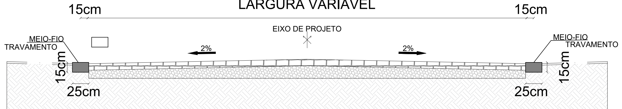
DETALHE - PISTA ROLAMENTO COM MEIO-FIO DE TRAVAMENTO s/escala 25x15cm