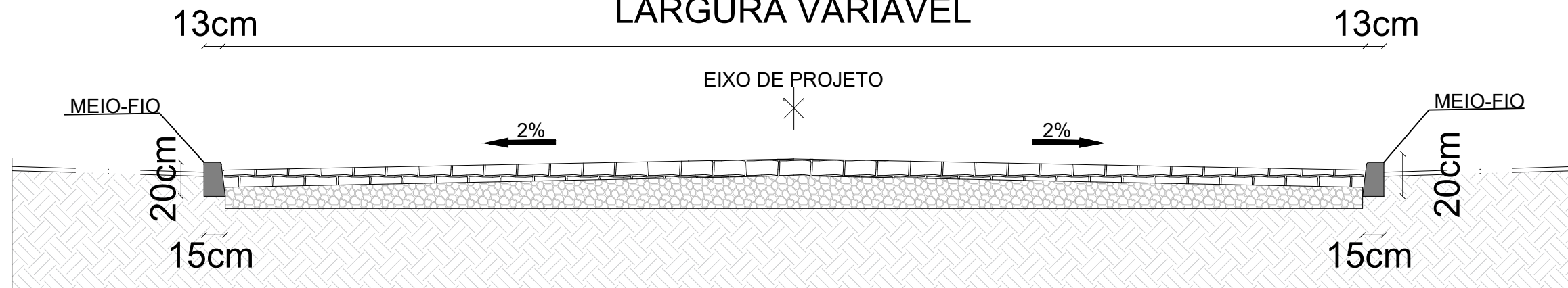
DETALHE - PISTA ROLAMENTO COM MEIO-FIO PRÉ-MOLDADO s/escala 100x15x13x20cm