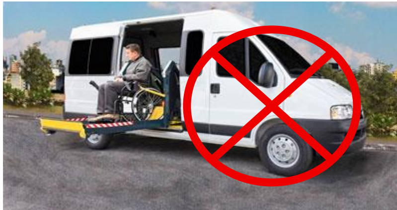
2. Exemplo inadequado ao objeto de compra.

Será permitida a instalação de itens opcionais somente se necessários à adaptação da acessibilidade.