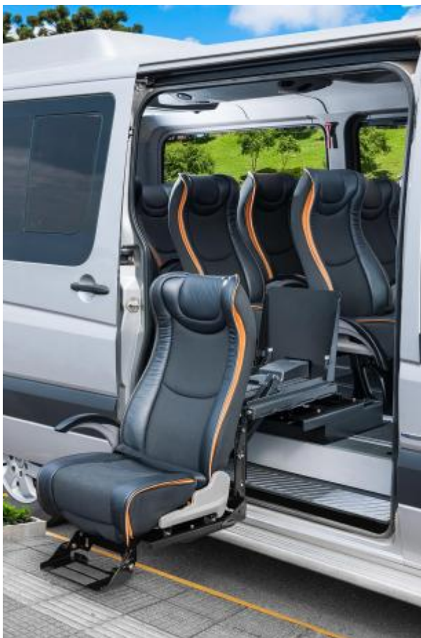
1. Exemplo correto de DPM para aquisição.

plataforma elevatória para deficientes, cadeira de rodas e similares da mesma categoria NÃO estão no escopo previsto do objeto de aquisição.