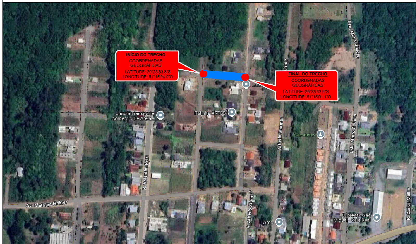
MAPA DE LOCALIZAÇÃO - S/ ESC.