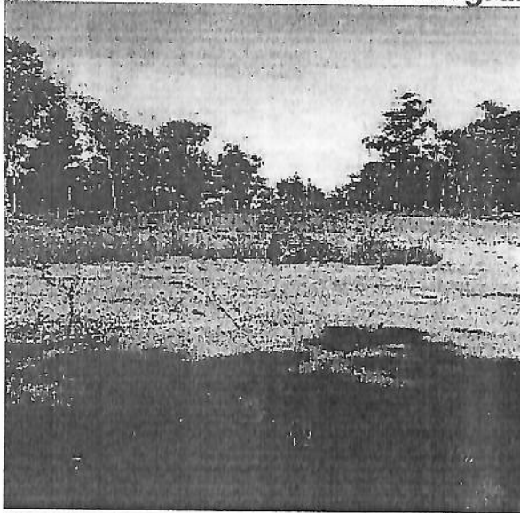
Foto 3. Área Degrada