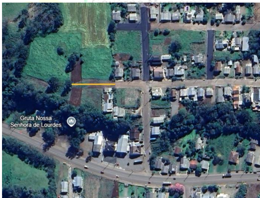
Trecho da Rua Constante Lóticí a receber pavimentação