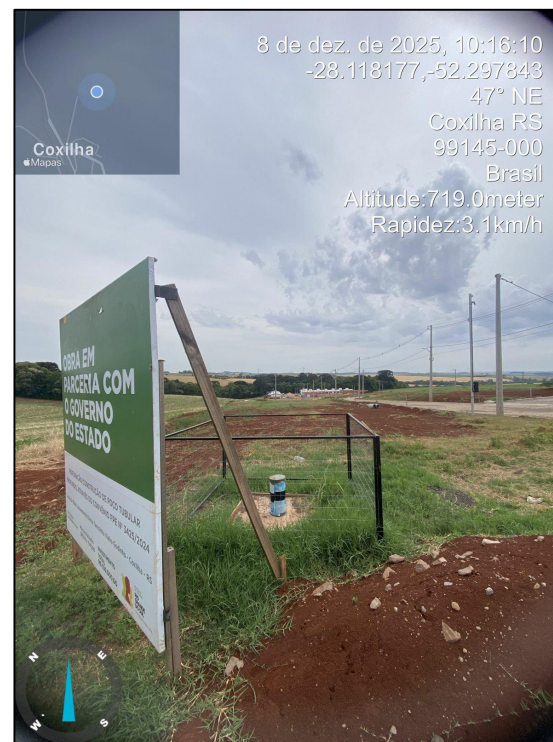
LOCALIZAÇÃO GEORREFERENCIADA POÇO

OBRA/LOCAL: ESTRUTURA RESERVATÓRIO DE ÁGUA LOTEAMENTO ELOIZA TEREZINHA VIEIRA GODINHO, COXILHA-RS