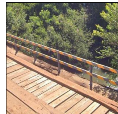
Exemplo guard rail

OBSERVAÇÃO: TODAS AS MEDIDAS DEVEM SER CONFERIDAS IN LOCO ANTERIORMENTE.