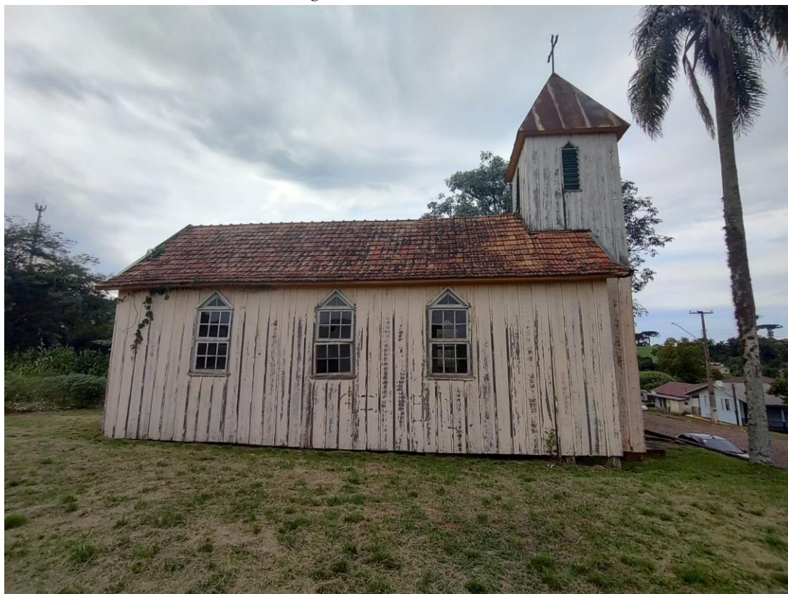
Imagem: Fachada Lateral.

“Coração Verde do Rio Grande. Doe Órgãos, Doe Sangue: Salve Vidas”