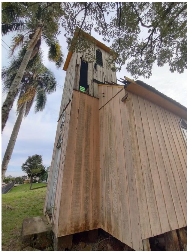
Imagem: Lateral do sino.