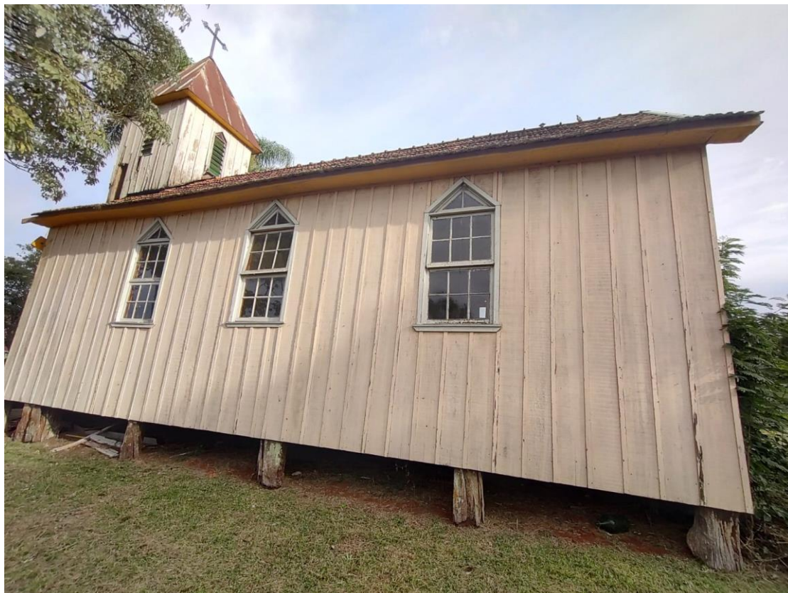
Imagem: Fachada Lateral.