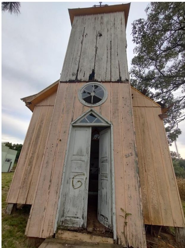
Imagem: Fachada Frontal.