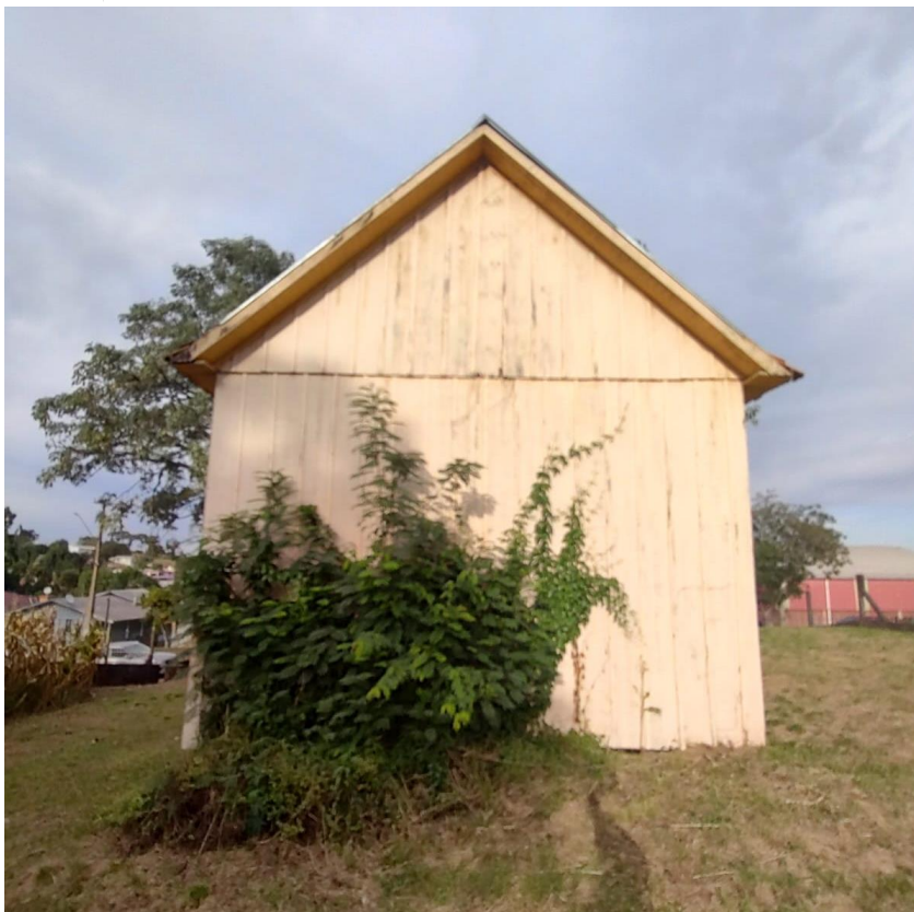
Imagem: Fachada dos fundos.