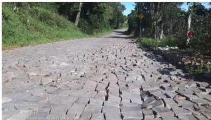
Imagem 02: Um dos pontos a ser recuperado na Estrada da Linha Um Sul.

Neste local deverá ser feito o reassentamento das pedras irregulares para calçamento da rua com a retirada e o reaproveitamento do material.