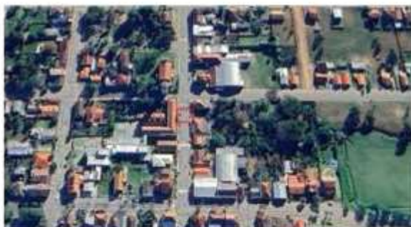
Imagem 01: localização da Meta 01

A Meta 01 está localizada na Avenida Francisco Guerino na quadra entre a Rua Dom Albino Luciani e a Rua Antônio Américo Vedoim.