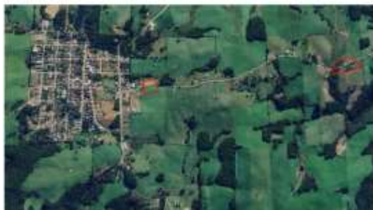
Imagem 01: localização da Meta 04

A Meta 04 está localizada na Estrada da Linha Um Sul.