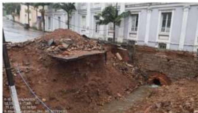
Imagem 04: Dano na galeria de água pluvial.

Na Avenida Francisco Guerino a força da água da enchente destruiu a galeria subterrânea de água da chuva e arrancou o pavimento existente conforme mostra a imagem 04 abaixo.