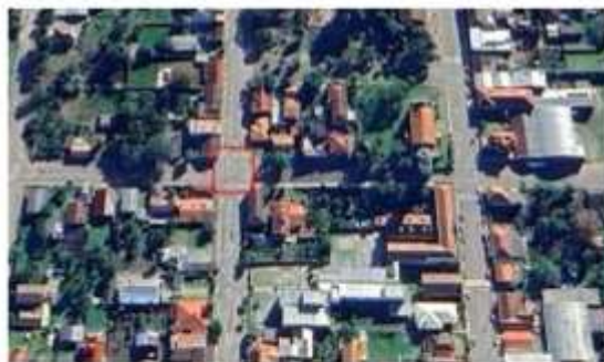
Imagem 02: localização da Meta 02

A Meta 02 está localizada no cruzamento entre a Avenida Vitélio Zago e a Rua Dom Albino Luciani.