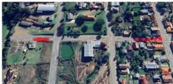
Imagem 03: localização da Meta 03

A Meta 03 está localizado em trechos da Rua Dom Albino Luciani entre a Avenida Vitélio Zago e o limite da Zona Urbana do município.