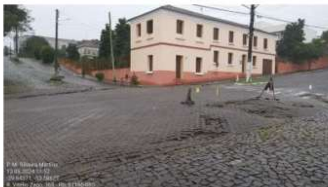
Imagem 05: Pavimento intertravado com deformações.

A obra da Meta 02 será no cruzamento da Avenida Vitélio Zago com a Rua Dom Albino Luciani, medindo 560m 2 de extensão de intervenção, neste local a Avenida Vitélio Zago tem a pavimentação com pavimento intertravado de blocos de concreto do tipo de 16 faces e 10cm de espessura.