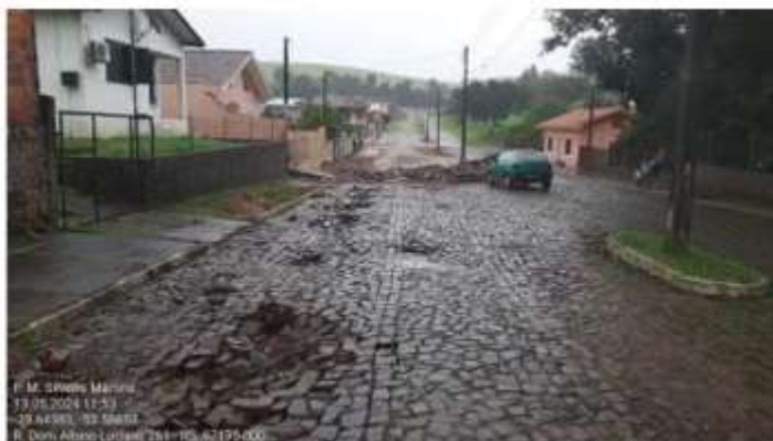
Imagem 06: Um dos pontos a ser recuperado na Rua Dom Albino Luciani.

A obra da Meta 03 será na Rua Dom Albino Luciani em pontos localizados entre a Avenida Vitélio Zago e o limite da Zona Urbana do município e consiste na recolocação das pedras irregulares de calçamento que foram removidas ou deslocadas pela força da água da chuva da enchente em um total de 546,00m 2 . A imagem abaixo mostra um dos pontos que vão receber os reparos.