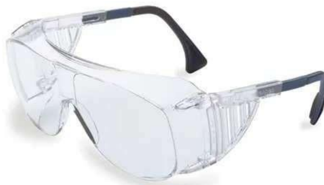
Figura 1: Imagem meramente ilustrativa do produto.

OCULOS DE PROTECAO C/ARMAÇAO E VISOR CONFECC. EM PEÇA UNICA DE POLICARBONATO INCOLOR, HASTES TIPO ESPATULA C/VENTILAÇÃO INDIRETA E C/REGULAGEM DE TAMANHO, C/TRATAMENTO ANTIEMBAÇANTE, DEVE PERMITIR O USO DE OCULOS DE GRAU, C/C.A.