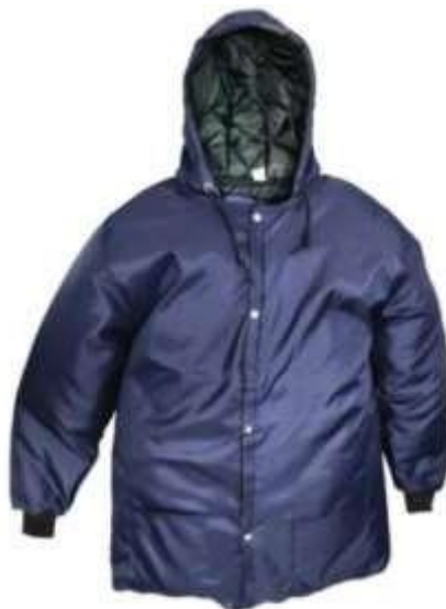
Figura 1: Imagem meramente ilustrativa do produto.