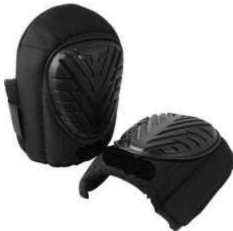
Figura 1: Imagem meramente ilustrativa do produto. Em caso de divergência, prevalecem as especificações contidas no texto.