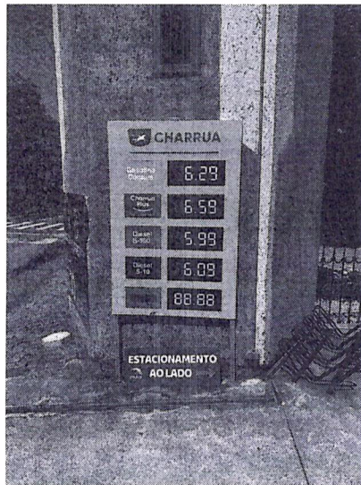
Posto Roda Mais

Avenida Presidente Lucena, 3566, Picada Holanda, Picada Café/RS.