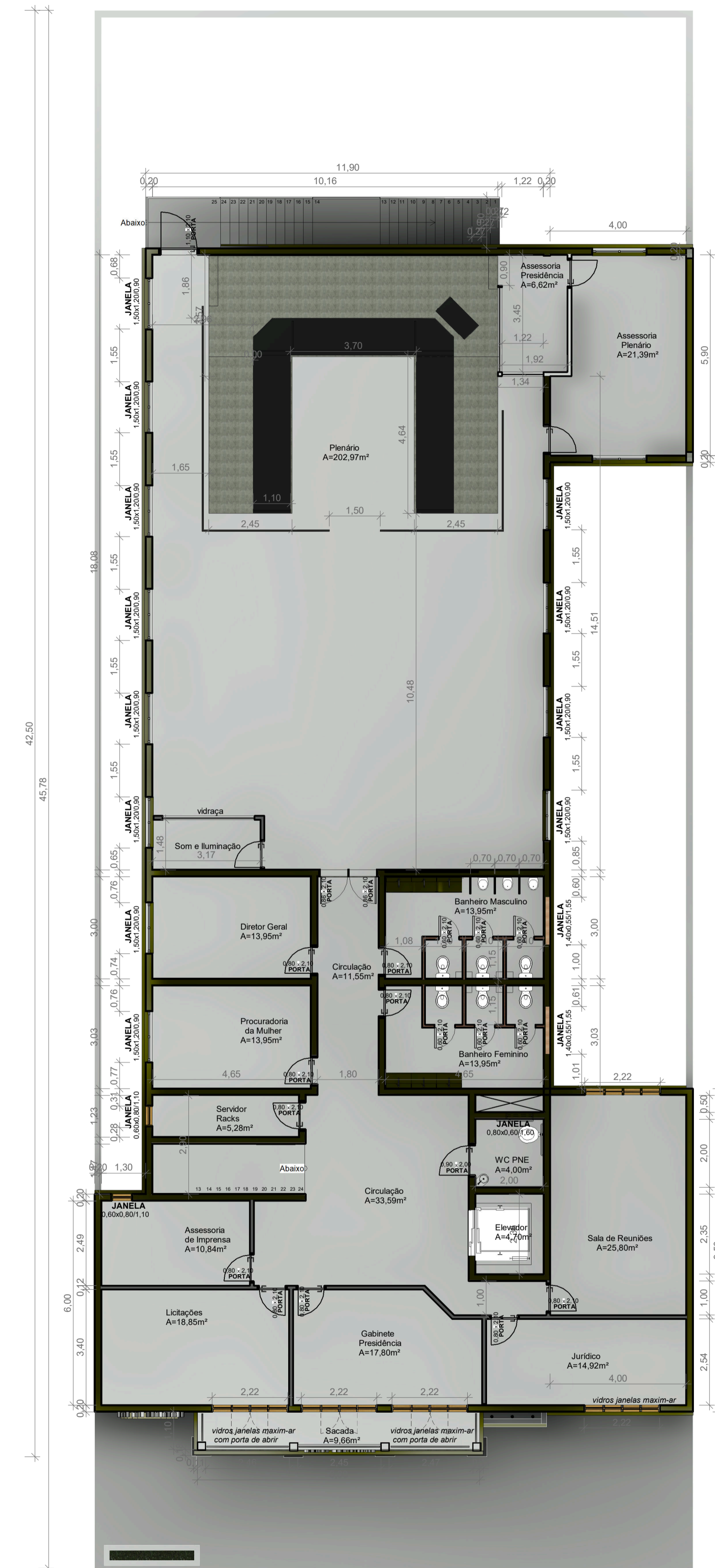
2 SUPERIOR ESCALA 1:100