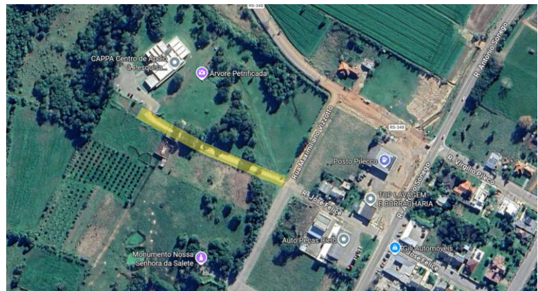
Figura 1: Trecho a ser reparado e pavimentado.