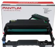
PHOTO CONDUTOR DL-425X 25K

Rendimento: 15.000 Pg Garantia: 12 meses - Contra defeitos de fabricação.