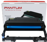
PHOTO CONDUTOR DL-5120 30K

Rendimento: 25.000 Pg Garantia: 12 meses - Contra defeitos de fabricação.