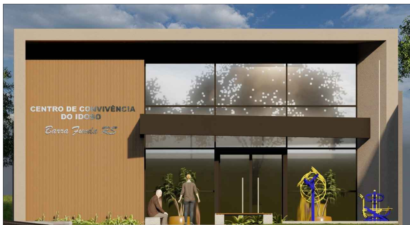
FACHADA FRONTAL Esc.: 1/75