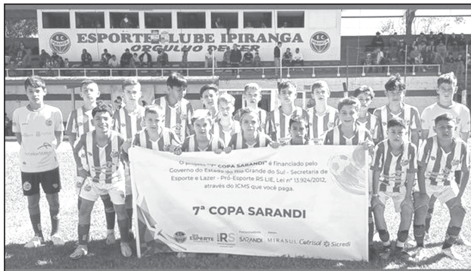
Juventude foi o campeão da 7ª Copa Sarandi

07h30min: Juventude x Azuriz 08h45min: Novo Hamburgo x Red Bull Bragantino 10h: Avaí x Cruzeiro 11h15min: Ipiranga x Novo Horizonte 12h30min: Americano x Atlético Sul Brasil 13h45min: Internacional x Grêmio 15h: Vila Nova x Juventus