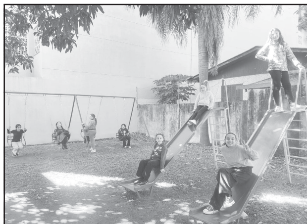
Praça da entidade foi renovada