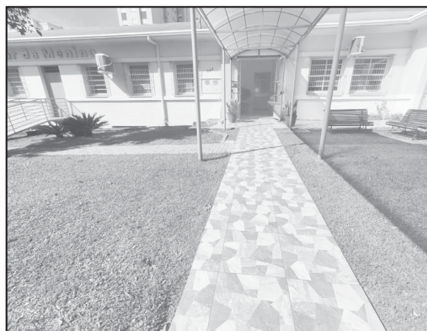
Calçada em frente ao Lar da Menina foi revitalizada

Durante a visita, foram apresentadas as músicas “Epo Itai” e “Paz”, em um gesto de carinho e gratidão a todos que contribuíram e acreditaram no trabalho desenvolvido pela entidade.