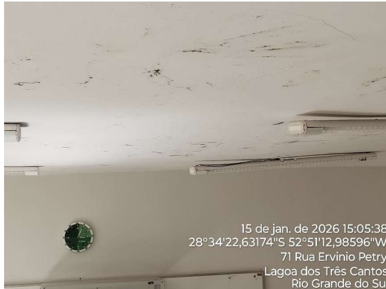
Figura 2: Flecha na laje, sala 02