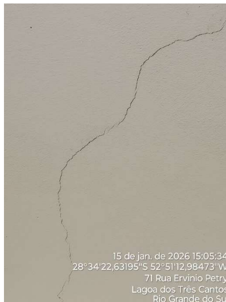
Figura 3: fissura no revestimento da laje

A laje é projetada com estrutura composta por vigotas de pré-moldado pró tendida. Foi executada in loc. Revestimento composto por chapisco, emboço e reboco.