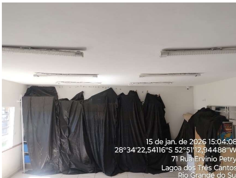
Figura 1: Flecha da laje, sala 01

Em vistoria realizada no referido local, observou-se a condição das estruturas de concreto armado. De acordo com acompanhamento constante, observa-se o aumento da flecha da laje de cobertura da laje. Recentemente, surgiram trincas no revestimento das lajes.