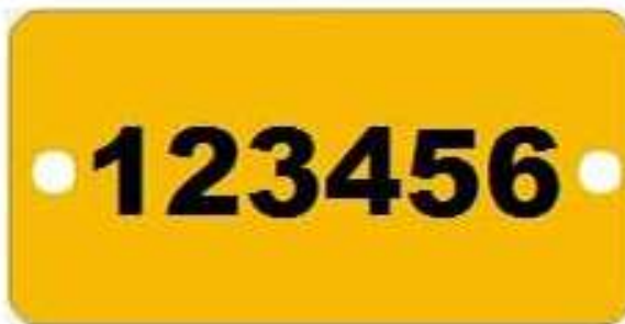
Figura 1 – Sugestão de plaqueta de identificação do ponto de IP

19.8.10 A execução dos serviços necessários para a manutenção e modernização do parque de iluminação se dará através de ações preventivas e corretivas. Cada ponto cadastrado, a contratada deverá identifica-lo com plaqueta, utilizando de numeração compatível com o sistema de gestão de iluminação pública. Esta plaqueta deverá ser composta material acrílico com alumínio, de alta espessura, resistente às intempéries e poderá ser de cor amarela com letras pretas e/ou branco com letras verdes.