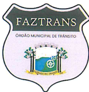
Brasão – Adesivo Capô