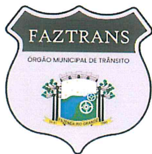
Brasão – Adesivo Portas