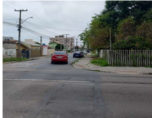
Rua Aluísio de Azevedo - esquina com a R. Casimiro de Abreu (Lado Direito)