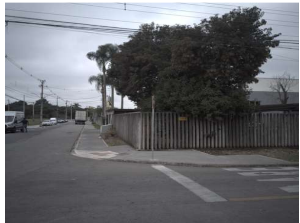
Rua Aluísio de Azevedo - esquina com a R. Antônio de Castro Alves (Lado Esquerdo)