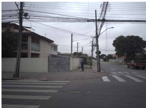
Rua Aluísio de Azevedo - esquina com a R. Guilherme Ceolin (Lado Esquerdo)