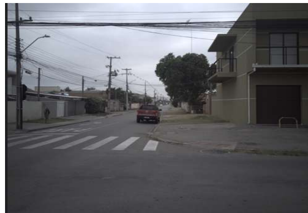
Rua Aluísio de Azevedo - implantação de vagas de estacionamento, esquina com a R. Guilherme Ceolin (Lado Direito)