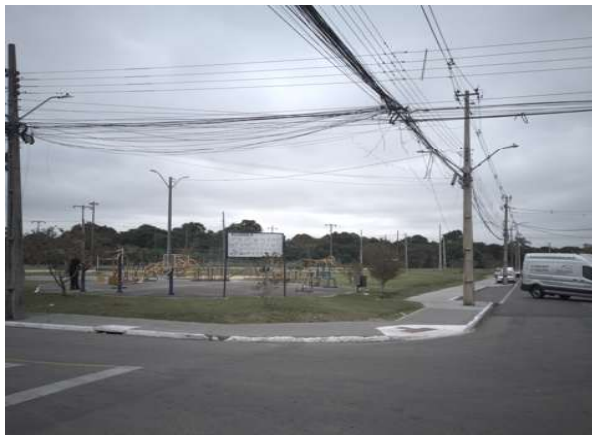
Rua Aluísio de Azevedo - esquina com a R. Rui Barbosa (Lado Direito)