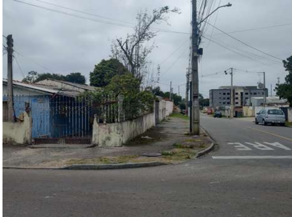
Rua Aluísio de Azevedo - esquina com R. Rui Barbosa

Município: Pinhais Projeto: Rua Aluísio de Azevedo