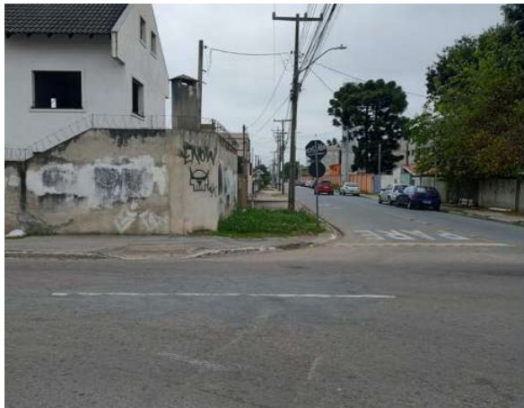
Rua Aluísio de Azevedo - esquina com a R. Casimiro de Abreu (Lado Esquerdo)

Município: Pinhais Projeto: Rua Aluísio de Azevedo