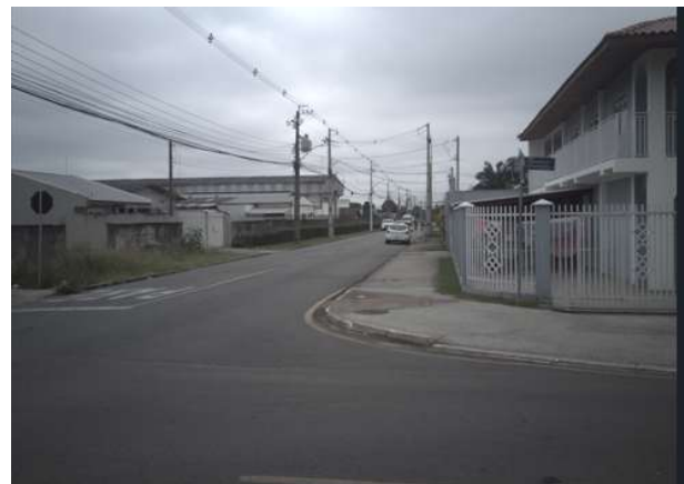
Rua Aluísio de Azevedo - esquina com a R. José de Alencar (Lado Direito)