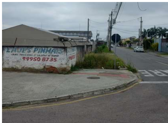
Rua Aluísio de Azevedo - esquina com a R. José de Alencar (Lado Esquerdo)