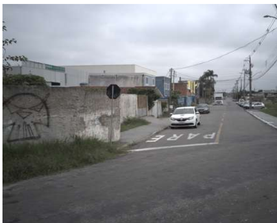
Rua Aluísio de Azevedo - esquina com a R. Antônio de Castro Alves (Lado Direito)