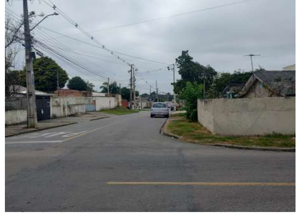
Rua Aluísio de Azevedo - esquina com a R. Rui Barbosa (Lado Esquerdo)