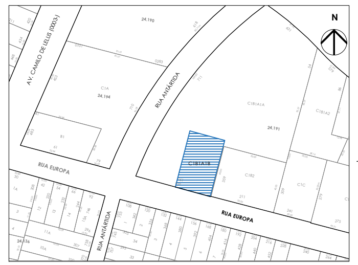
SITUAÇÃO esc 1/3000

ÁRVORES A MANTER, RETIRAR E PLANTAR - esc 1/200